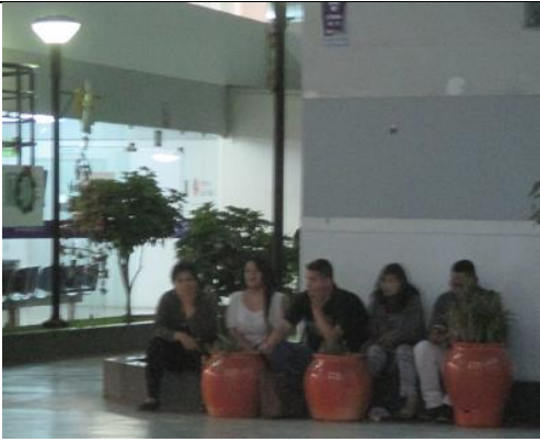
Un grupo de espías de servicios secretos esperando a su "acción" antes de mi curso de secretariado médico