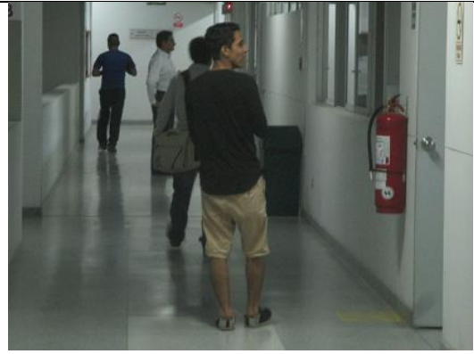
Un nuevo grupo de espías de servicios secretos que ven el instituto la primera vez orientándose donde es cual oficina

En total ese Instituto San Pablo con su mafia de Opus Dei gay infértil es un instituto terrorista : --- celebran el Papa gay infértil pedófilo criminal con sus obispos pedófilos criminales con un libro de Asia que NO ES DEL PERÚ – y el Vaticano está en el narcotráfico con la mafia italiana Ndrangheta --- sale un Instituto Diablo Pablo donde solo hay la guerra religiosa con terror psicológico contra Madre Tierra y contra curaciones simples de la medicina natural para ahorrar gastos de la vida: