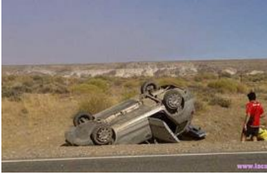
Traumatización: un accidente de tráfico