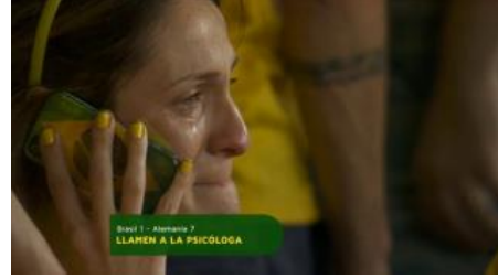
Traumatización: gana el falso equipo (Brasil-Alemania 1:7 - llaman a la psicóloga)

Salen clientes difíciles lo que puede ser causado por un choque mental, sobre todo accidentes y la pregunta de la culpa, o cuando la "falsa persona" o el "falso equipo" gana en la tele. Ese escenario se encuentra sobre todo en la Emergencia de hospitales: