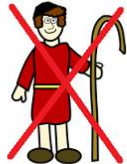
Pastor psicópata con fantasía judía