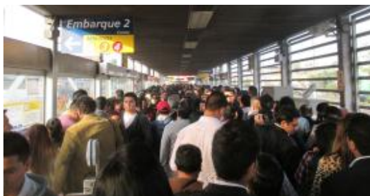
Una cola eterna en un paradero del Metropolitano (Izaguirre) (13-06-2016 - 7:43am) - el paradero es demasiado pequeño - eso vale también para otros paraderos - con el nuevo horario del año 2017 la situación en el paradero Izaguirre mejoró.

-- el Metropolitano es tan lleno así las mujeres no saben más como proteger sus pechos etc.