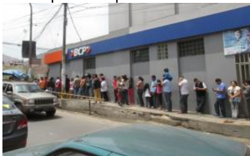
Cola en Comas para el banco BCP, 10-10-2015 - 10:58am

-- las colas hay también porque los bancos no garantizan un pago automático entre los bancos así mucha gente tiene que hacer pagos un cierto día - pero los bancos no son capaces de instalar bastante personal para reducir esas colas...